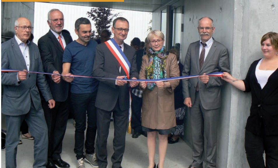
Habités depuis un an, les nouveaux appartements de la Résidence André-Duboc ont été inaugurés le 16 juin 2016