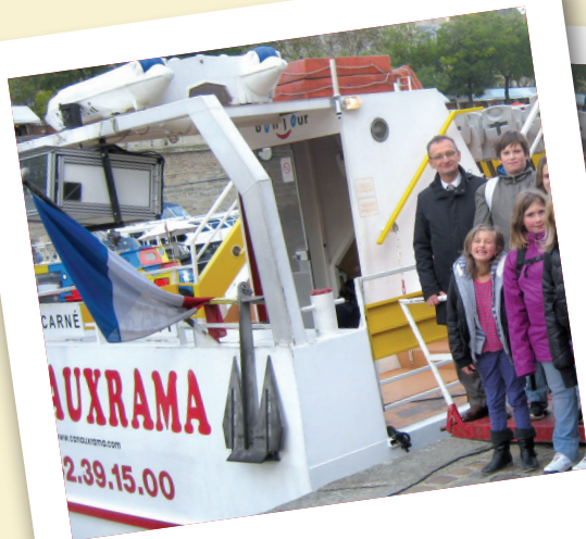
Le CME en visite...