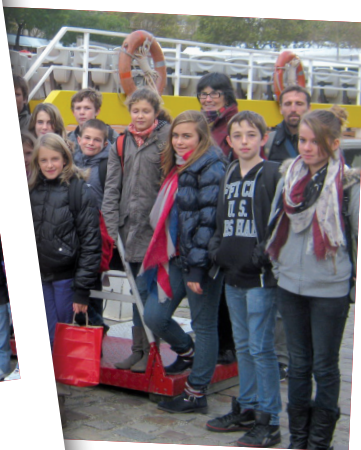
... à Paris !

Profitant des vacances scolaires, les 5 et 6 novembre derniers, le Conseil Municipal d'Enfants s'est rendu à Paris. Ce séjour avait un but principal : découvrir tous les secrets de la distribution de l'eau potable dans une grande ville comme Paris. Après une navigation insolite sur les eaux tranquilles du canal Saint-Martin, les enfants ont visité le Pavillon de l'Eau, récemment rénové et installé sur les bords de Seine. Là, ils ont appris que la consommation journalière de la ville de Paris en eau potable est de 550 000 m 3 . Produite par Eau de Paris à partir d'eaux souterraines et d'eaux de rivières, celle-ci est acheminée jusqu'aux fontaines publiques et aux robinets de tous les Parisiens. Après ce voyage, les jeunes élus se sentent aujourd'hui encore plus inves-